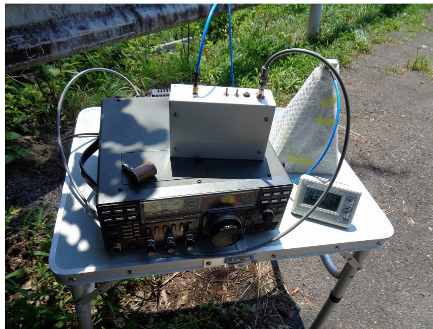
Photo4. 今回の受信用機器(バッテリーを除く)